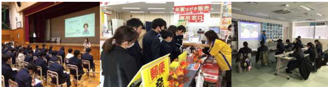
※1学年県内自主研修・職業人の話を聞く会の様子

10月に行った校内合唱コンクールなど、学校生活の中でも、東向陽台中生の活躍する姿、成長した姿をたくさん見る事ができました。一方で、先日の学年懇談会でも話題となりましたが、改善すべき課題も見られました。年明け、1月8日（木）から始まる、後半の学校生活では、それぞれの学年のまとめをしっかり行いながら、生徒一人一人がより成長できるように支援・指導していきたいと思っております。引き続きご協力をよろしくお願いいたします。