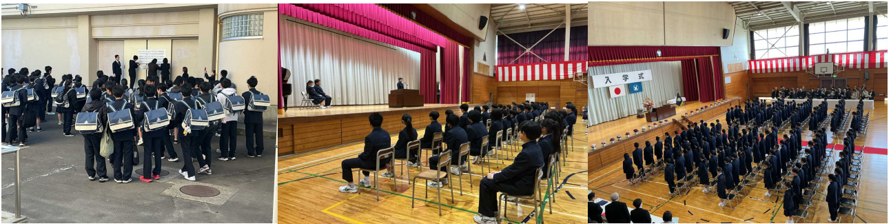
令和8年度 東向陽台中学校教職員の紹介

今年度も、生徒一人一人が充実した学校生活を過ごし、心身共に成長できるように全職員一丸となって教育活動に取り組んでまいります。保護者の皆様のご支援・ご協力をよろしくお願いいたします。